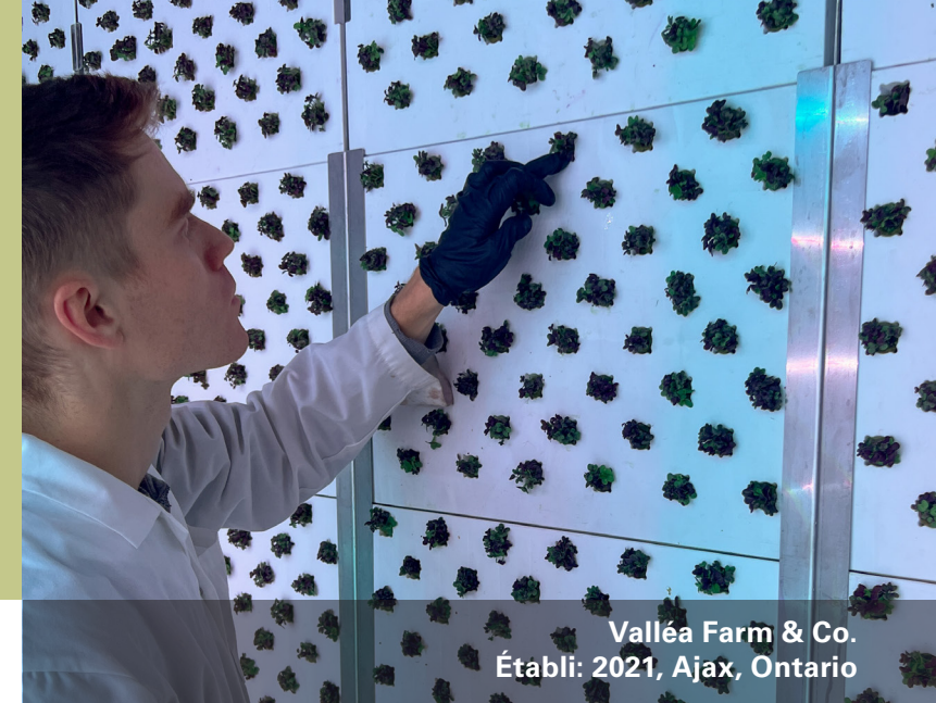
Valléa Farm & Co. Établi: 2021, Ajax, Ontario

Fondée en 2021, la ferme a été créée autour d'une idée simple : cultiver des produits exceptionnels tout au long de l'année, à proximité des personnes qui les consomment. Ce qui a commencé dans un entrepôt de 3 000 pieds carrés à Oshawa est devenu un terrain d'essai pour perfectionner les méthodes de culture en mettant l'accent sur la saveur, la fraîcheur et la constance. Leur ferme verticale s'étend sur 7 500 pieds carrés où ils cultivent des produits sans herbicides ni pesticides dans un environnement intérieur contrôlé. L'entreprise emploie actuellement quatre personnes et prévoit d'agrandir son équipe au cours de l'année à venir.