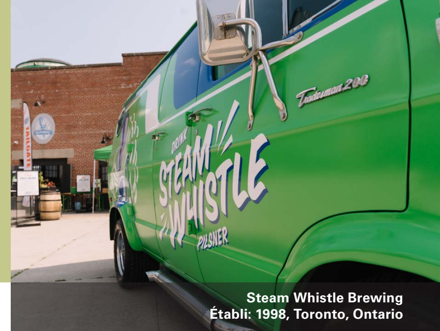
Steam Whistle Brewing Établi: 1998, Toronto, Ontario