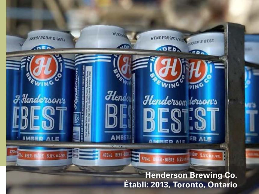
Henderson Brewing Co. Établi: 2013, Toronto, Ontario