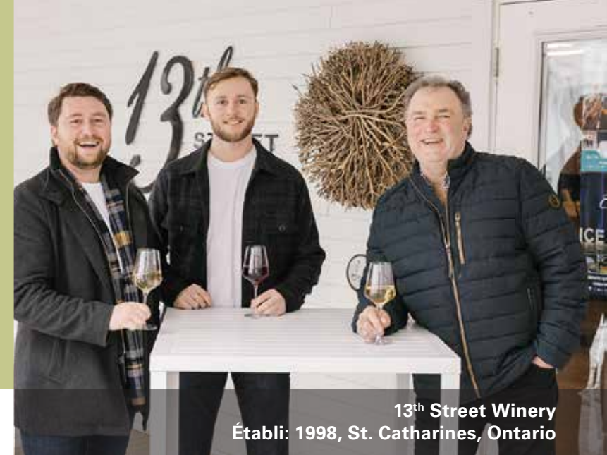
13 th Street Winery Établi: 1998, St. Catharines, Ontario