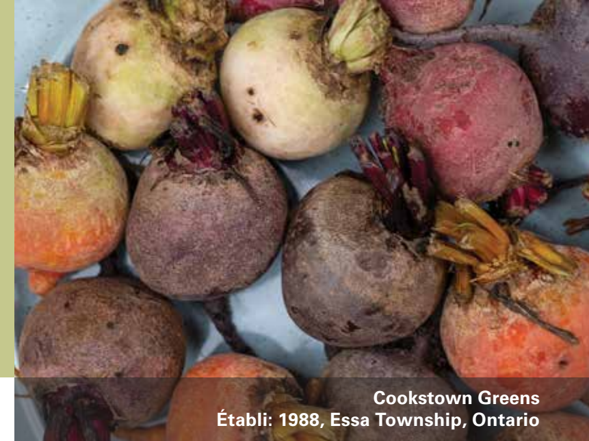
Cookstown Greens Établi: 1988, Essa Township, Ontario