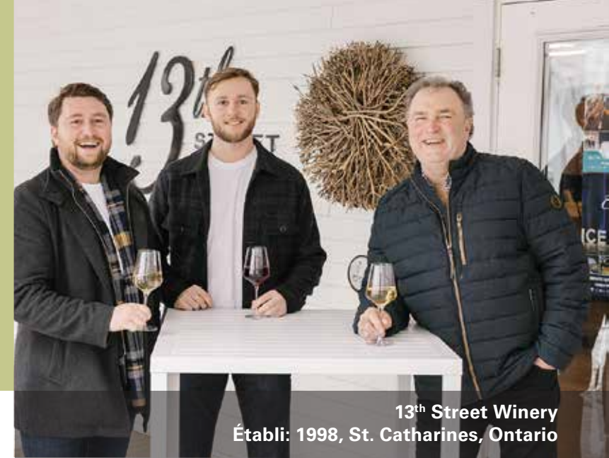
13 th Street Winery Établi: 1998, St. Catharines, Ontario